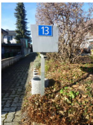
Hier einbiegen, 1. Haus