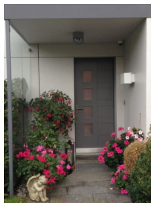
Eingang Nr. 13